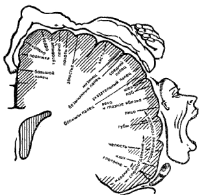
Рис. 2. Человечек Пенфилда. В нем проекции всех частей тела в двигательной области мозга показаны в образной форме. Именно величина проекции кисти и ее близость к моторной речевой зоне навели на мысль о том, что тренировка тонких движений пальцев рук окажет большее влияние на развитие активной речи ребенка, чем тренировка общей моторики.

Возвращаясь к анатомическим отношениям, исследователи обратили внимание на то, что около трети всей площади двигательной проекции занимает проекция кисти руки, расположенная очень близко от речевой моторной зоны. Особенно наглядно огромная площадь проекции кисти представлена на рис. 2. Это так называемый гомункулус (человечек) Пенфилда.